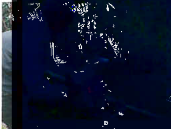
厂区总排口 (DW001) ★1) 废水