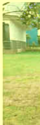
厂界西侧（○2）无组织排放废气