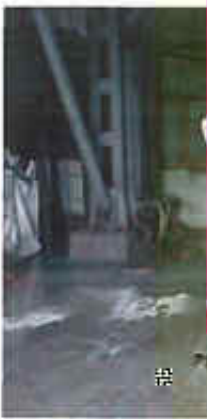
固化后飞灰堆放点 (■) 固体废物