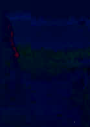
地下水下游监测井 (☆3)