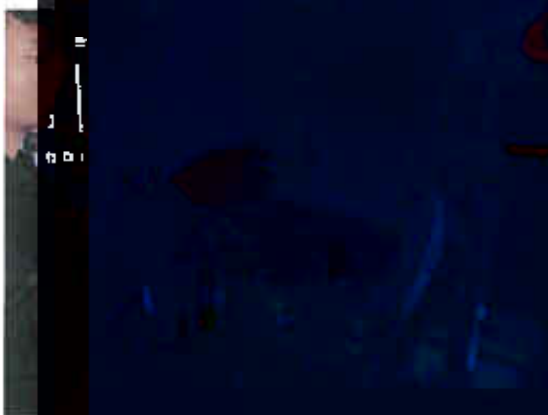
垃圾渗滤液排放 (DA003) ★3) 废水