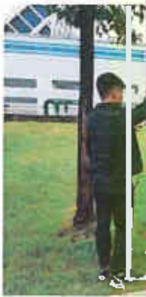
厂界西侧 (○3) 无组织排放废气