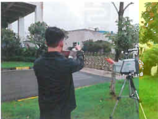
厂界东侧（○1）无组织排放废气