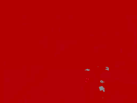
#焚烧炉 (■2) 固体废物