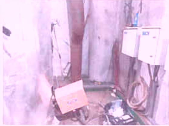
1#排气筒 DA001 (①) 有组织排放废气