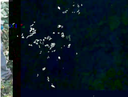
地下水上游监测井 (☆2)