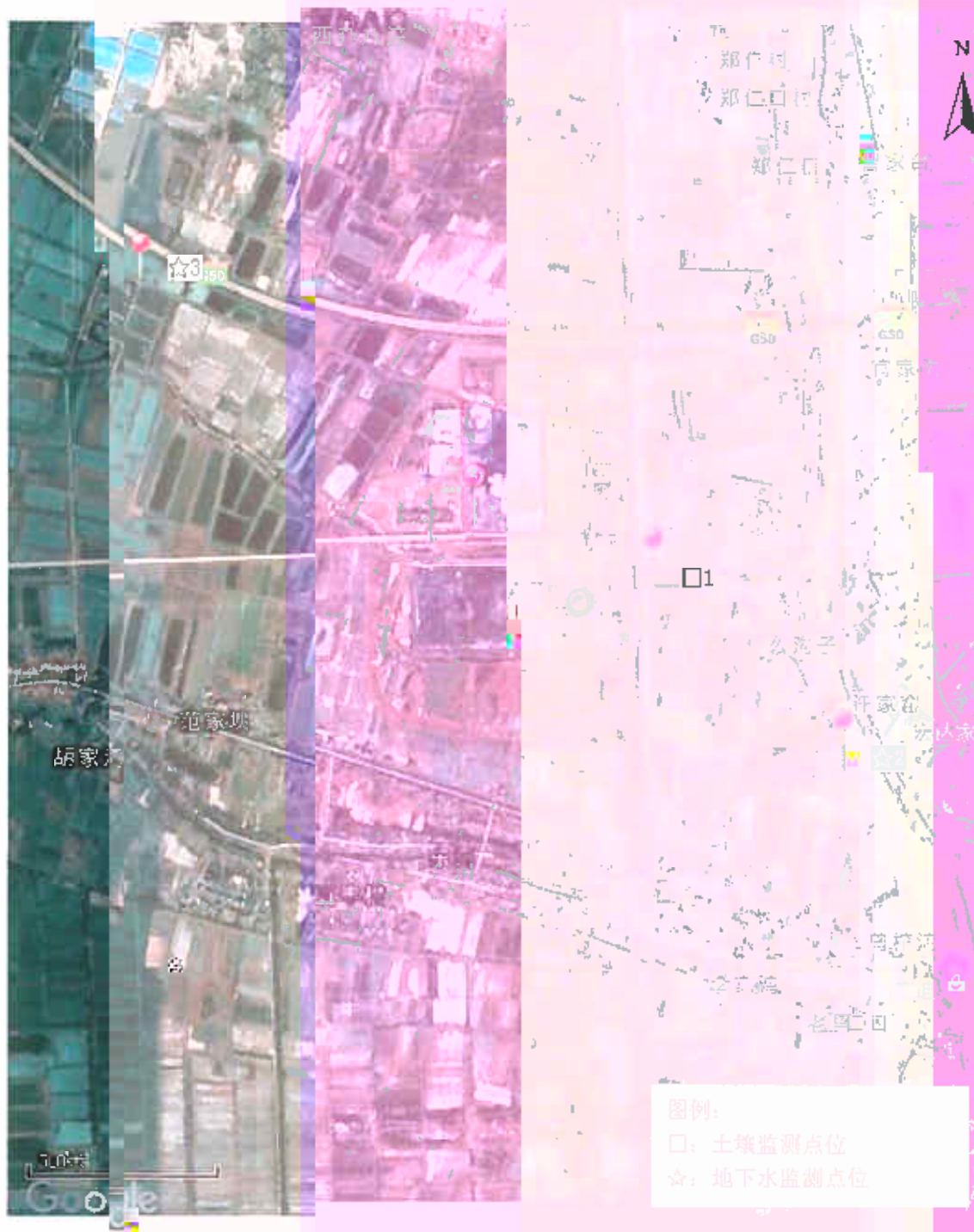
附图 1：监测点位示意图-1