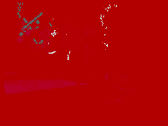
界南侧 (○) 无组织排放废气