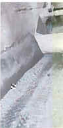
2#焚烧炉 (■3) 固体废物